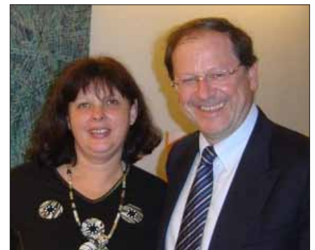
Hervé Novellivel, a KKV-ért felelős francia miniszterrel

Mint emlékeztet, a jelentést 2008 októberében a vállalkozói érdekképviselettel folytatott széleskörű egyeztetés előzte meg, ennek köszönhető, hogy a hazai javaslatok is bekerülhettek. A jelenlegi gazdasági helyzetben mindent meg kell tenni az európai foglalkoztatás gerincét adó kis- és középvállalkozások